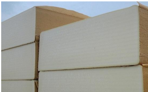
加工ロスの少ない真四角なブロック形状